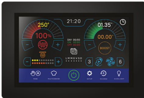
NAPOLI Finitura alluminio NAPOLI Aluminium finish

The installation is easy and fast: connect the electricity plug and a short pipe. This will join the oven to the extracting hood or to the exterior of the building, to allow the outflow of cooking steams and smells.