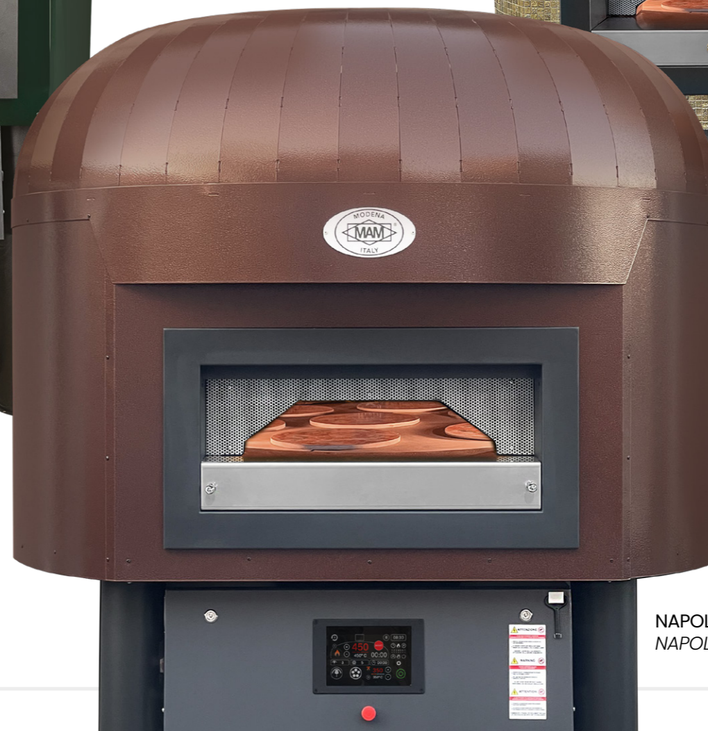
NAPOLI Finitura Spicchio vernicita NAPOLI Spicchio painted finish