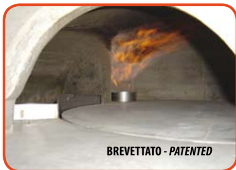
BREVETTATO - PATENTED